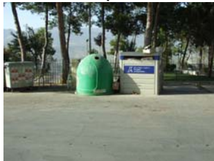
La Guardia (casco urbano)