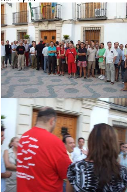
Vecinos en plaza del Ayuntamiento

Como ya es sabido por todos, el fin de semana (del 3 al 5 de agosto) vivimos una situación insostenible con el tema del agua. Hubo cortes, poca presión y lo más inaceptable, familias que llevaban ya días sin gota de agua. Ante esta situación, el sábado 4, un grupo de vecinos, de forma espontánea, comenzaron a moverse para buscar soluciones al tema. Primero fueron unos cuantos, y estos "picando" en los porteros automáticos de las casas, a las 14,30 horas (cayendo un sol de justicia en aquellos momentos), animaron al resto a reunirnos a las 7 de la tarde para concretar medidas a tomar. La respuesta fue importante (ya lo vemos en las fotos), se recogieron firmas y se le trasladaron al Sr. Alcalde en el Ayuntamiento. Hubo una reunión entre éste, el 2º Teniente de Alcalde y una representación de vecinos que el Sr. Alcalde aceptó, (puesto que a los Concejales, representantes legales de los ciudadanos no los dejó entrar, ni UUG, ni PSOE). De esta reunión parece que ser que hemos sacado en claro que el Sr. Alcalde va a coger "al toro por los cuernos". Confiamos que con las medidas que se vayan a emprender se solucione este problema para siempre. Pero sobre todo, los vecinos necesitamos información, saber a que obedecen estos cortes (sabotaje, avería, falta de agua...), saber que pasa con la calidad del agua, ¿es apta o no es apta para el consumo humano? En definitiva los ciudadanos "QUEREMOS SABER SR. ALCALDE", sobre todo en temas de competencia municipal.