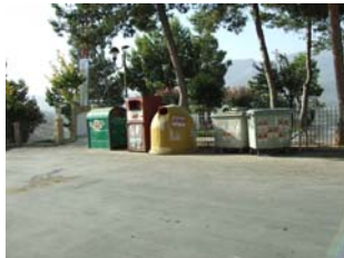
La Guardia (casco urbano)

¿Aprecian alguna diferencia entre las fotografías de las zonas de recogida de residuos urbanos/reciclaje?