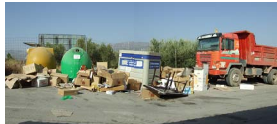
Urbanización "Ciudad Jardín - Entrecaminos"