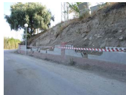
Entrada a las Lomas (drcha)