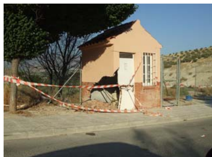
La Yuca (caseta motores depuradora)

En otro orden de cosas, queremos traer también a este, nuestro primer boletín, la situación en que se encuentra la entrada a las Lomas (ya en el editorial nos referimos a él) y el de la Yuca. Nos gustaría saber ¿cuándo y por quién? se tienen que solucionar estas deficiencias. Las fotos nos muestran el estado tan lamentable en que se encuentran y el peligro que puede entrañar para los más pequeños. "QUEREMOS SABER SR. ALCALDE".