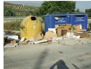
Urbanización "Las Lomas"