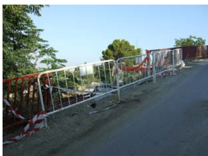
Entrada a las Lomas (izqda)