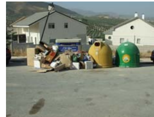
Urbanización "Altos del Puente Nuevo"