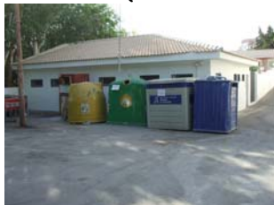
La Guardia (casco urbano)