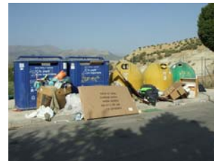
Urbanización "La Yuca"