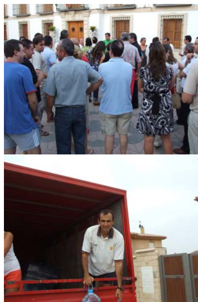
Vecinos repartiendo garrafas de agua

En otro orden de cosas, queremos traer también a este, nuestro primer boletín, la situación en que se encuentra la entrada a las Lomas (ya en el editorial nos referimos a él) y el de la Yuca. Nos gustaría saber ¿cuándo y por quién? se tienen que solucionar estas deficiencias. Las fotos nos muestran el estado tan lamentable en que se encuentran y el peligro que puede entrañar para los más pequeños. "QUEREMOS SABER SR. ALCALDE".