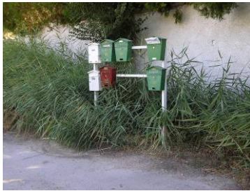
Se limpió unos días antes de las elecciones, pero ahora ¿Necesita mantenimiento? Boletín UUG Agosto 2007.