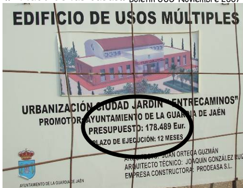
El Edificio de Usos Múltiples se presentó "a bombo y platillo en abril de 2006". Plazo de ejecución de 1 año