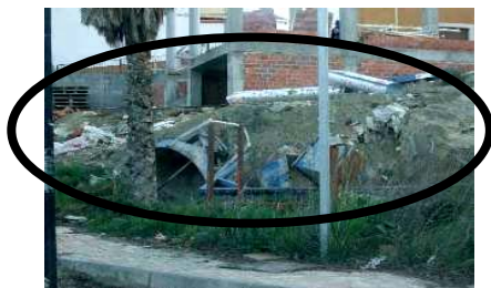
Escombrera en la entrada a "Altos del Puente Nuevo". Febrero 2008