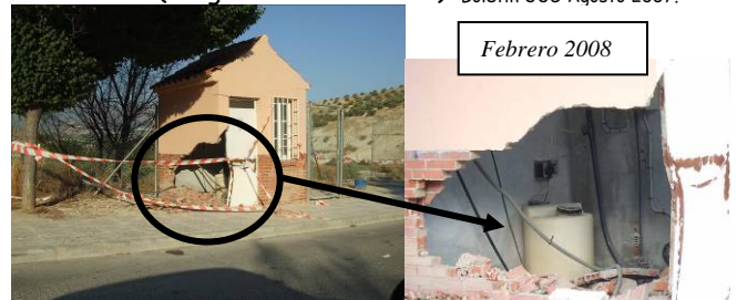
La Yuca (caseta motores depuradora). Ya han quitado la cinta. ¿Se arreglará? Boletín UUG Agosto 2007.