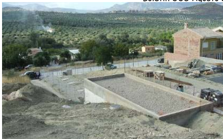
Instalación Depuradora "Altos del Puente Nuevo". ii Al lado de las casas!! Boletín UUG Noviembre 2007