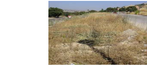
Actuación de repoblación forestal en "Altos del Puente Nuevo" (Programa electoral PP). Boletín UUG Agosto 2007.