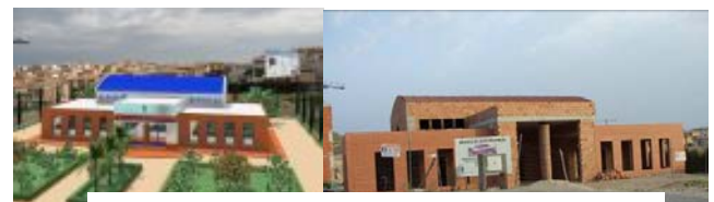
"con bombo y platillo" "sin bombo y platillo"