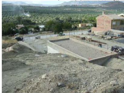
Instalación Depuradora "Altos del Puente Nuevo". ii Al lado de las casas!! Noviembre 2007