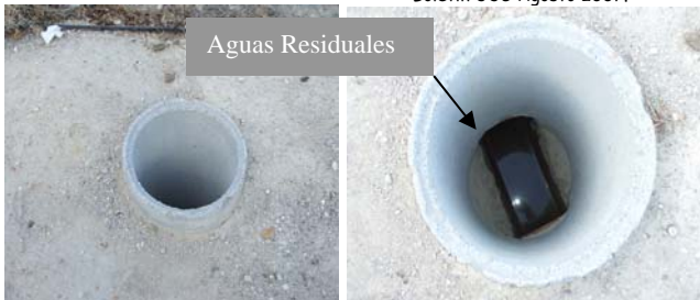
Colector de La Yuca. Un peligro para los niños. Noviembre 2007