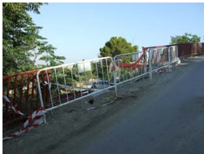
Entrada a las Lomas (izda.) Boletín UUG Agosto 2007.