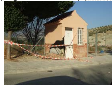
La Yuca (caseta motores depuradora). Boletín UUG Agosto 2007.