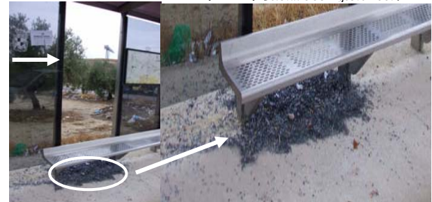
Parada de bus urbano: ¿Cuánto tiempo llevan los cristales en el suelo? ... Noviembre 2007