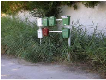
Se limpió unos días antes de las elecciones, pero ahora ¿Necesita mantenimiento? Boletín UUG Agosto 2007.