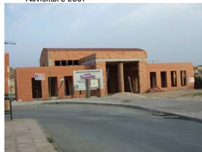
Edificio de Usos Múltiples (Entrecaminos). Parado desde las elecciones. Noviembre 2007