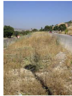
Actuación de repoblación forestal en "Altos del Puente Nuevo" (Programa electoral PP). Boletín UUG Agosto 2007.