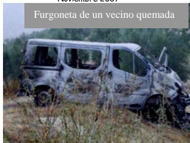
Furgoneta de un vecino quemada